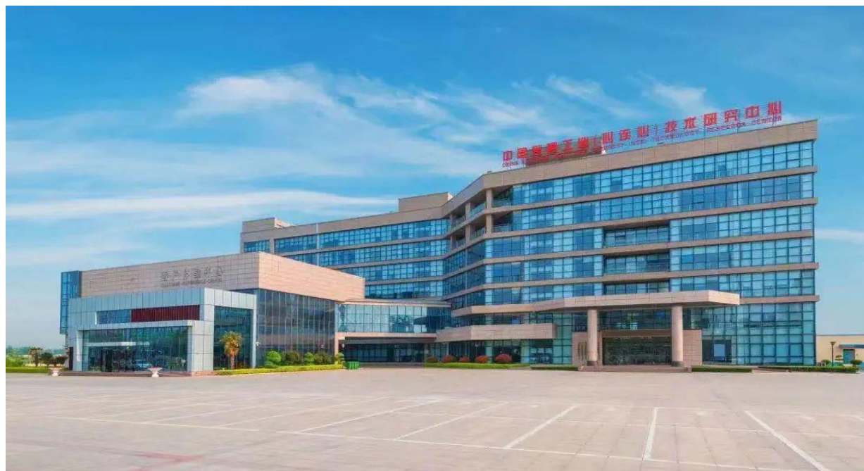
中国氮肥工业（心连心）技术研究中心